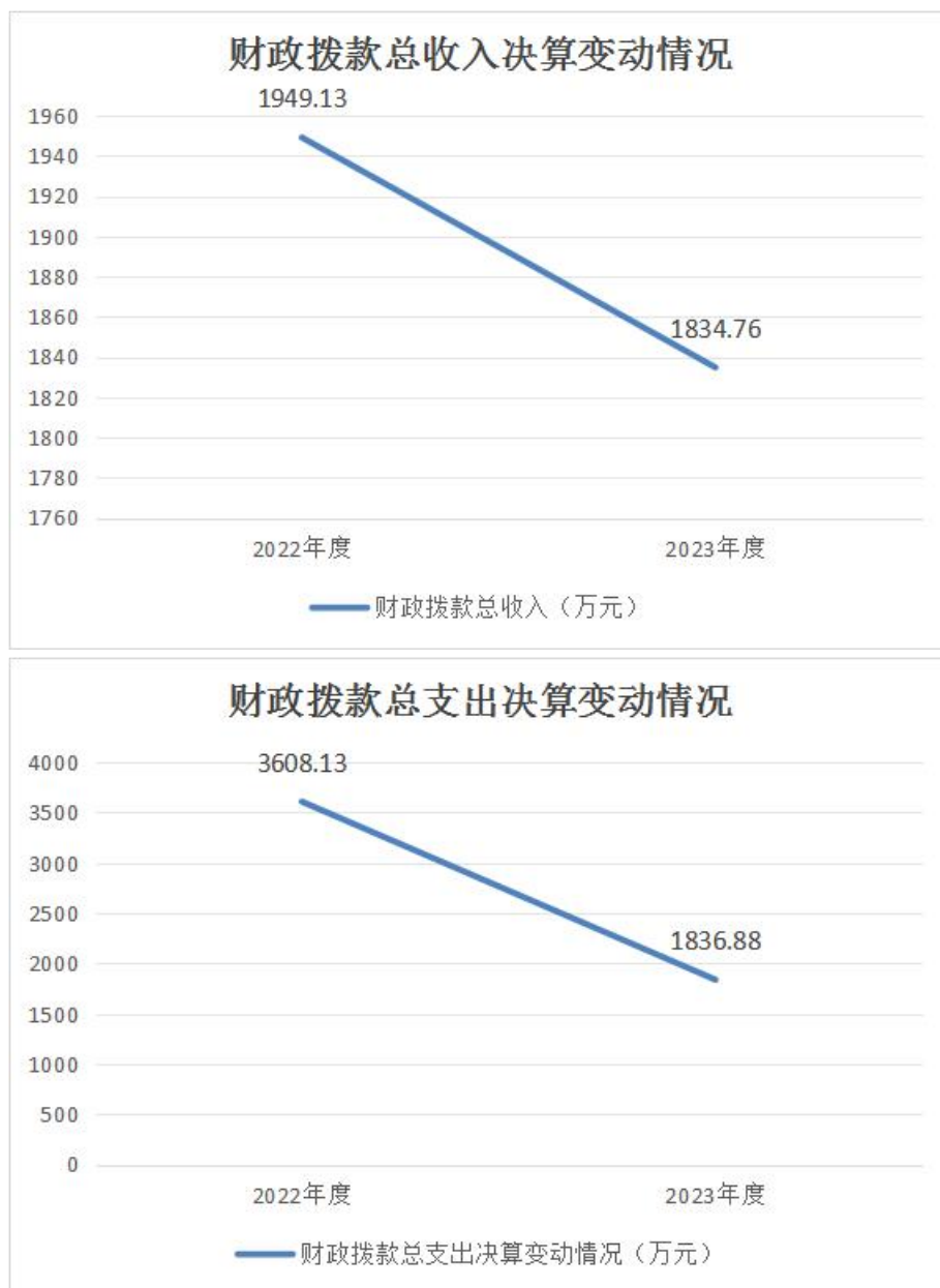
图 4：财政拨款收、支决算总计变动情况

决算数无变化。国有资本经营预算财政拨款收入 0 万元，与 2022 年度决算数无变化。